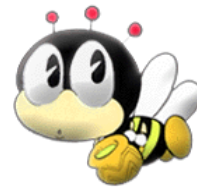
マスコット「マナビイ」 デザイン：石ノ森章太郎

大桑村教育委員会・大桑村公民館(TEL**55-1020 FAX**55-2607) 大桑村ホームページ http://www.vill.ookuwa.nagano.jp/