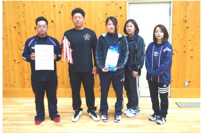
▲優勝チーム“どんぐりん”のみなさん

9月5日に開幕し、11チームによる熱戦が繰り広げられた2018年ソフトバレーリーグ戦。10月31日に最終試合が行われ、順位が確定しました。選手や応援に来てくださったみなさま、お疲れ様でした!