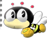
マスコット「マナビイ」 デザイン：石ノ森章太郎

大桑村教育委員会・大桑村公民館（TEL**55-1020 FAX**55-2607） 大桑村ホームページ http://www.vill.ookuwa.nagano.jp/