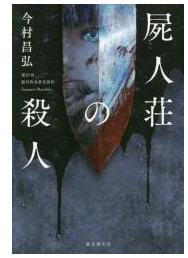
屍人荘の殺人 今村昌弘 東京創元社