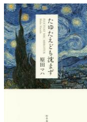
たゆたえども沈まず 原田マハ 幻冬舎