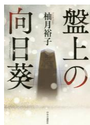
盤上の向日葵 柚木裕子 中央公論新社