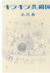
キラキラ共和国 小川 糸 幻冬舎