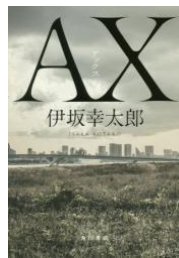
AX 伊坂幸太郎 KADOKAWA