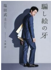
騙し絵の牙 塩田武士 KADOKAWA