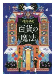
百貨の魔法 村山早紀 ポプラ社