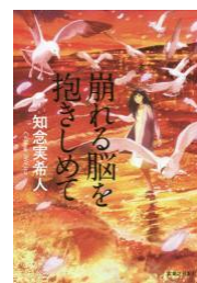
崩れる脳を抱きしめて 知念実希人 実業之日本社