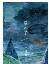
星の子 今村夏子 朝日新聞出版

図書室ご利用ください 【平日】 9時～17時、18時～20時 【休日】 9時～17時 *平日の18時以降及び休日に図書室を利用されるときは、体育館窓口へお申し出ください。