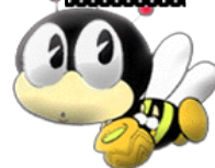
マスコット”マナビイ” デザイン：石ノ森章太郎

大桑村教育委員会・大桑村公民館 (TEL**55-1020 FAX**55-2607) 大桑村ホームページ http://www.vill.ookuwa.nagano.jp/